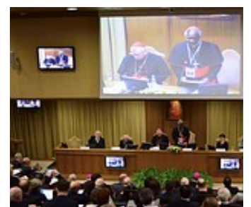
10日、バチカンで始まった に関する国際会議